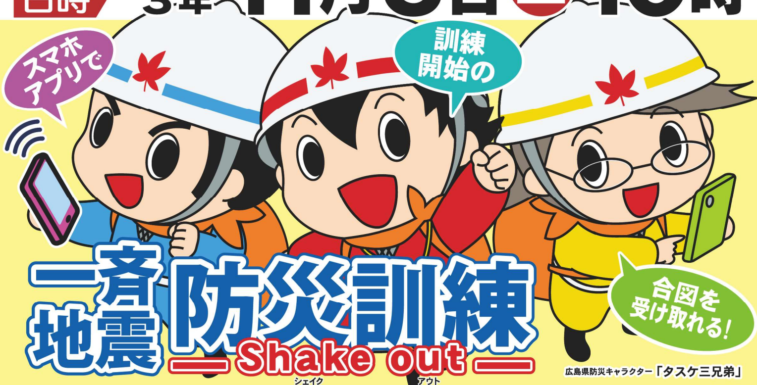
広島県防災キャラクター「タスケ三兄弟」